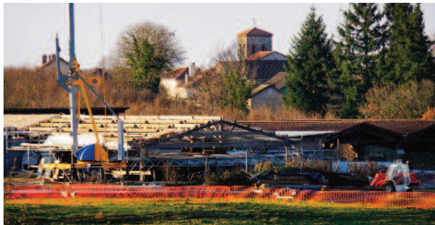
Remise en place des couvertures de tuiles

l'association des Amis de Chassenon est la seule à pouvoir œuvrer à la participation des usagers à la vie du site. En complément, plusieurs membres verraient bien l'association élargir ses actions au territoire de la commune, voir à celui de la Haute-Charente. D'autres se soucient de l'absence de Chassenon dans la promotion touristique régionale, et dans les projets structurants du Département. L'association gagnerait à attirer quelques personnalités susceptibles de renforcer son audience auprès des partenaires. La réunion a également été l'occasion d'enregistrer des promesses d'adhésions et des candidatures pour le futur conseil d'administration. L'assemblée générale 2017 aura une importance particulière pour la mise en place de la nouvelle équipe en charge de l'association. Elle se tiendra à la salle des fêtes de Chassenon le samedi 22 avril à 15 heures. Il reste, bien entendu, un sentiment de frustration face à