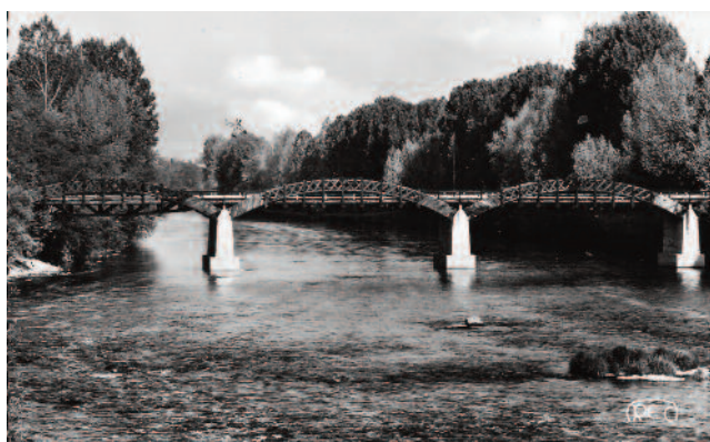
Le pont provisoire et sa passerelle en bois

Après avoir livré le nouveau pont à trois arches de béton, l'administration démontra les huit baleines et les laissa sur place à disposition de la municipalité. Celle-ci les stocka sur un terrain communal situé en haut du village du Breuil, au sud de la commune.