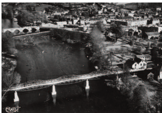
L'ancien pont de Chabanais vers 1955 et les baleines au premier plan

reconstruction fut longue dans cette période de l'après-guerre où la pénurie touchait tous les secteurs. Une passerelle provisoire avec circulation alternée fut mise en place sur l'arche de pierre endommagée. Mais les Ponts-et-Chaussée avaient un autre projet dont ils rêvaient depuis longtemps : faire un pont neuf à Chabanais, digne d'une route nationale. Le vieux pont médiéval était condamné. Il fallut attendre 1955 pour voir débuter sa démolition puis la construction du nouveau, qui ne fut achevé qu'en 1958.