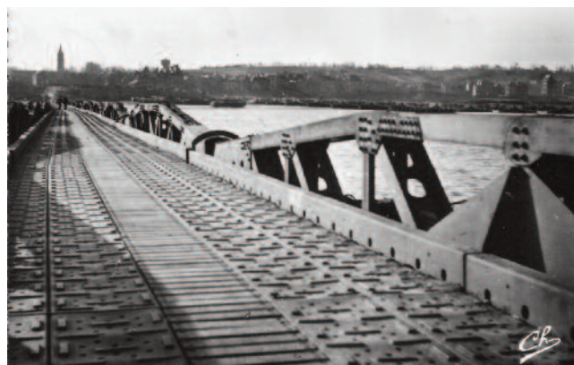
Les baleines à Arromanches

Au total 15 kilomètres de voies flottantes sont mis en fabrication par les Anglais pour les deux ports du débarquement, Mulberry A (Omaha Beach) et Mulberry B (Arromanches). Comme souvent, rien ne se passe tout-à-fait comme prévu. Durant la traversée de nuit, 40 % du matériel flottant est perdu en mer avant d'approcher des côtes françaises. Le 19 juin, le port de Mulberry A est totalement disloqué par la tempête. Il sera abandonné sur place. En effet, les Américains, responsables de ce site, ne faisaient pas vraiment confiance aux baleines de conception anglaise ; ils lui préféraient un système de caissons plus petits, assemblables de manière rigide, qu'ils avaient eux-mêmes fabriqués en quantité.