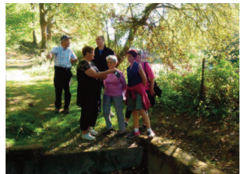
Le parcours à l'essai en septembre dernier

La municipalité de Chassenon est soucieuse de la mise en valeur de la nature et du patrimoine de la commune. Elle souhaitait baliser un circuit piétonnier de découverte du bourg. Elle a donc accepté de réaliser en 2017 le projet conçu par les Amis de Chassenon : une boucle de 3800 mètres autour du bourg, sur des chemins en majorité non revêtus. Les marcheurs pourront partir de la place de l'église ou bien de l'entrée de Cassinomagus à Longeas. Une douzaine de curiosités seront signalées par des panneaux, qui feront la part belle au gallo-romain. Merci à la municipalité pour son initiative, et rendez-vous dans quelques mois pour l'inauguration.